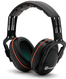
GEHÖRSCHUTZ 505 66 53-04